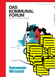
Ausgabe 9: Kommunale Wirtschaft ISBN 978-3-945564-25-7