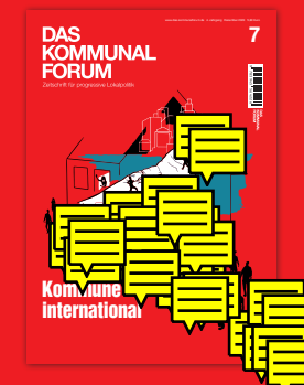
Ausgabe 7: Kommune international ISBN 978-3-945564-22-6

Diese Publikation wird mitfinanziert durch Steuermittel auf der Grundlage des von den Abgeordneten des Sächsischen Landtags beschlossenen Haushalts.