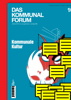
Ausgabe 10: Kommunale Kultur ISBN 978-3-945564-27-1